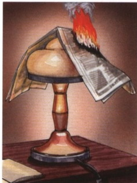
Затемнение электроламп сгораемыми материалами (бумагой, тканью)