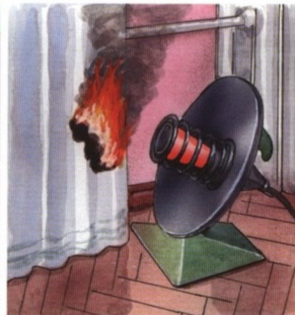
Оставление без присмотра электрических нагревательных приборов